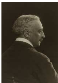
Georges Hugo , photographie de Gerschel, 1900, Maison de Victor Hugo © Gerschel frères / Maisons de Victor Hugo / Roger-Viollet