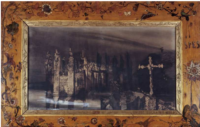
Le Burg à la croix , dessin de Victor Hugo, plume et lavis d'encre brune, 1850, Maison de Victor Hugo

pittoresques qu'il admire. Grâce à cette habileté, l'artiste développe dès 1830 un corpus dessiné plein d'imagination.