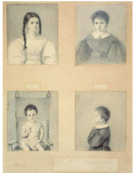
"Ses quatre enfants ensemble" dessin d'Adèle Hugo, Maison de Victor Hugo