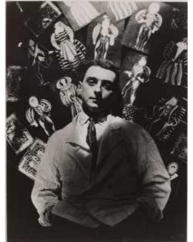
Jean Hugo devant ses dessins de costumes et décors pour Roméo et Juliette , photographé par anonyme, 1924