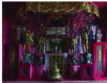
Le salon rouge à Hauteville House, 2015