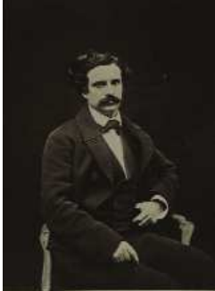
Charles Hugo, photographie d'Edmont Bacot, 1853., Maison de Victor Hugo. © Maisons de Victor Hugo / Roger-Viollet