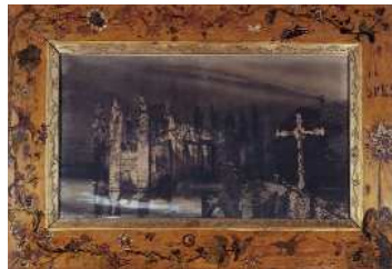
Victor Hugo à Hauteville House. Photographie d'Edmond Bacot, 1862, maison de Victor Hugo © Edmond Bacot / Maisons de Victor Hugo / Roger-Viollet