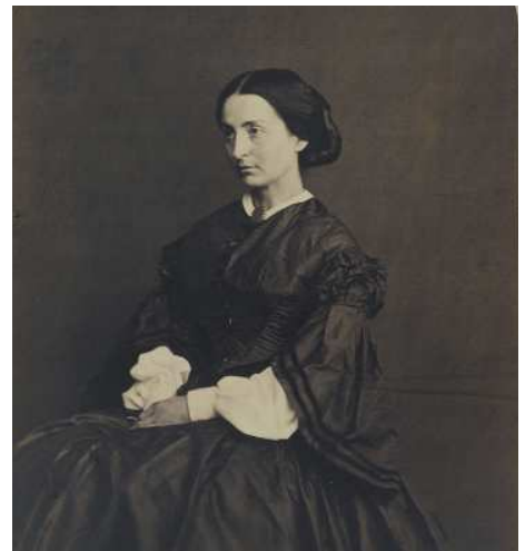
Adèle Hugo fille, photographie d'Edmond Bacot, 1862, Maison de Victor Hugo

Très tôt, sa mère lui donne une formation artistique qu'il a complétée auprès d'Horace Vernet. Il pratique la sculpture, mais aussi la peinture, le dessin et la gravure.