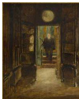
"L'Escalier du Look-out" par Georges Hugo, huile sur toile, s.d., Maison de Victor Hugo