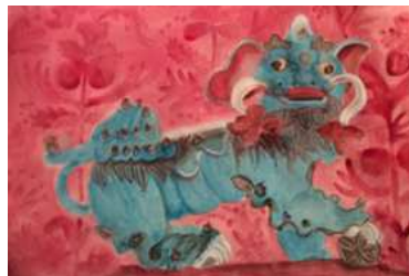
"Chien de Fô, salon rouge " pigments sur Arche de Marie Hugo © Marie Hugo