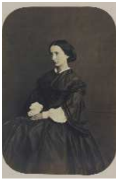
Adèle Hugo fille, Photographie d'Edmond Bacot, 1862, Maison de Victor Hugo, © Edmond Bacot / Maisons de Victor Hugo / Roger-Viollet