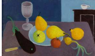
"Nature morte à l'aubergine". par Jean Hugo, huile sur toile, 1981, Maison de Victor Hugo, © Maisons de Victor Hugo / Roger-Viollet