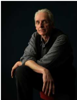
Jean Baptiste, photographe