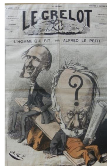
Alfred Le Petit « L'homme qui rit » in Le Grelot , Estampe