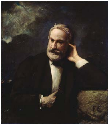
François Chiffart, Portrait de Victor Hugo , vers 1868, Maison de Victor Hugo